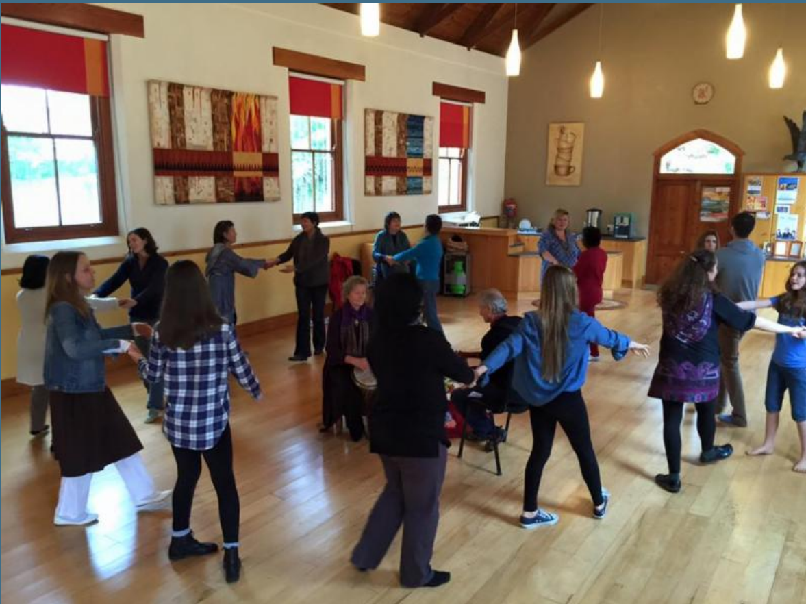
Начал танцы в Южной Африке в начале 2015 года.